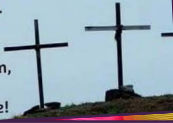
Op die heuvel ElsHengstman-van Olist

Ja, 't gebeurde op die heuvel de strijd werd daar gestreden, Hij offerde Zichzelf en bracht ons eeuwige Vrede!